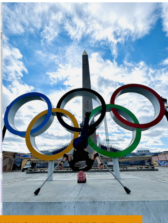
JEUX OLYMPIQUES ET PARALYMPIQUES, PARIS